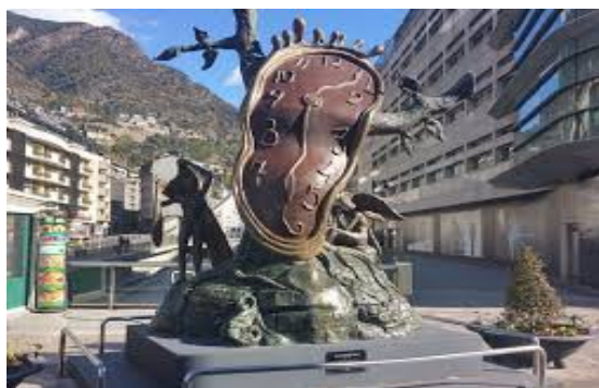
Illustration 4: Sculpture "La noblesse du temps" (Salvador Dali)