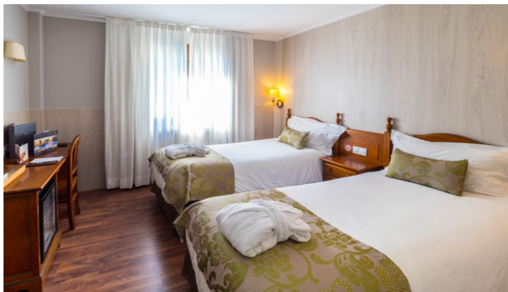
Illustration 2: Chambre standard 2 lits simples

Capacité pour 1-2 personnes : 1 Lit double ou 2 lits simples, Salle de bain/douche, sèche-cheveux, Peignoirs et chaussons pour spa, Téléphone direct, satellite/TV LCD-HD, radio TV, Mini-bar (boisson payante) avec frigo, WI-FI (gratuit), Coffre-fort.