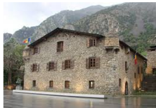
Illustration 3: La Casa de la Val (Ancien siège du Conseil Général)