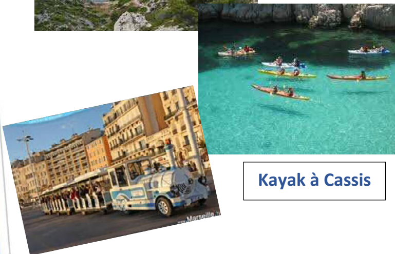
Kayak à Cassis