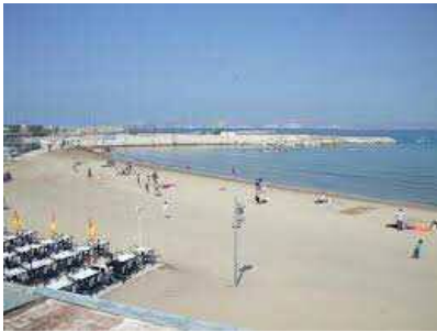
Plage Pointe rouge