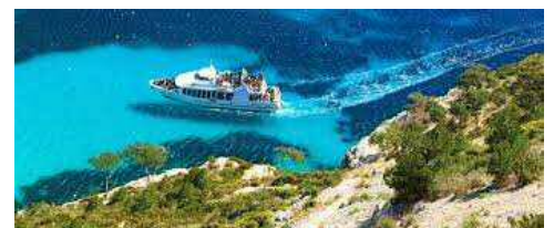
Bateau à Cassis