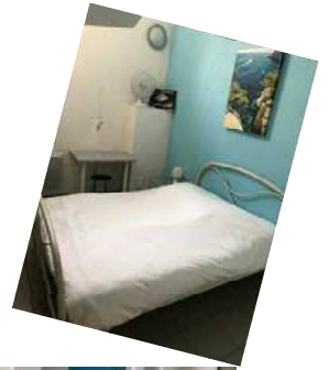
Balaena à pointe rouge