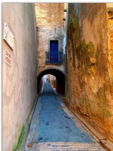
La rue du Moulin à huile.