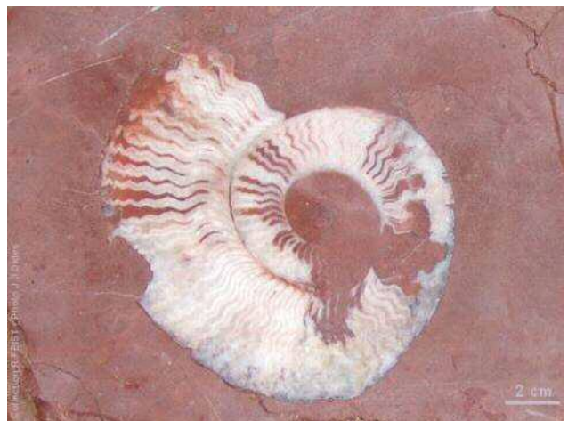
Goniatite (échantillon poli).